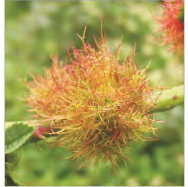
Sobre un rosal