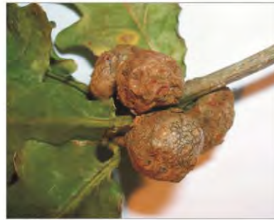
Sobre un roble