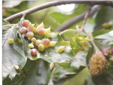
Sobre un haya