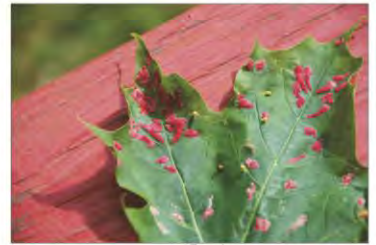
Sobre un arce

Son unas estructuras que aparecen en las plantas, inducidas por insectos, hongos, bacterias.... Es una respuesta de la planta a la presencia de un parásito. El tejido de la planta crece intentando aislar al parásito. Las formas de estas agallas son muy variadas.