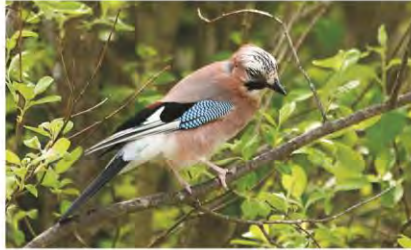
Arrendajo ( Garrulus glandarius )

Las plumas coberteras son una de sus características más llamativas, por el hermoso color azul con barras negras que lucen en ellas.